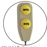
簡単操作リモコン